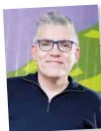
Auteur: Mark Weghorst

Het is wat waard dat informeren, steunen en signaleren nu echt een plek krijgen in alle samenwerkingsverbanden. Misschien kost het moeite om er werk van te maken en lijkt dat op gedoe, maar de ultieme opbrengst zou kunnen zijn dat er uiteindelijk veel minder gedoe overblijft. Ervaring leert inmiddels dat betere samenwerking leidt tot meer werkplezier voor alle partijen aan tafel. Het zou op termijn het werk van onderwijsconsulenten overbodig kunnen maken en zal zorgen voor een gelijkjer speelveld.