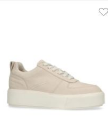
Sacha nubuck plateau sneakers beige 109.99 2 kleuren