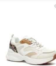
Scapino Blue Box chunky sneakers wit 29.99