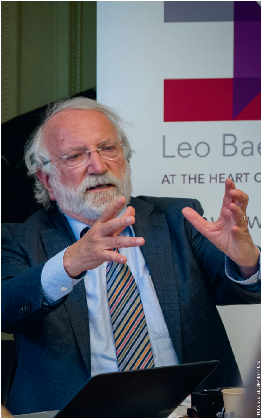
"Jongeren moeten gelijke kansen hebben, want anders blijven talenten verborgen en weten we niet wat ze werkelijk tot stand kunnen brengen in hun leven."

toe, toen hij een ridderorde kreeg uitgereikt. Je weet nooit waar jouw hulp aan bijdraagt."